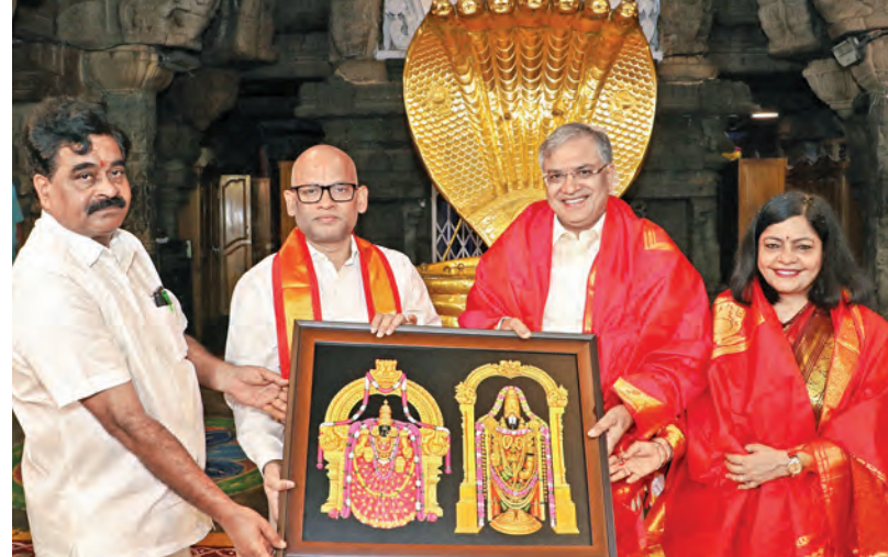
ఆదివారం తిరుపతిలో సిఇసి జ్ఞానేశ్వరమార్కు స్వామివారి చిత్రపటాన్ని అందజేస్తున్న దృశ్యం