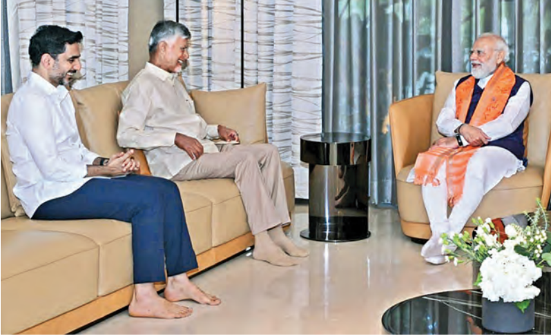
ఆదివారం హైదరాబాద్ లోని సిఎం చంద్రబాబు నివాసంలో సమావేశమైన ప్రధాని మోడీ, చిత్రంలో మంత్రి లోకేశ్

ప్రభాతవార్త ప్రధాన ప్రతినిధి, హైదరాబాద్, మే 10: హైదరాబాద్ వర్తమానలో భాగంగా ఎపి సిఎం నారా చంద్రబాబు ఇంటికి వచ్చిన ప్రధాని నరేంద్ర మోడీ గంటపైగా సమయాన్ని చంద్రబాబు నివాసంలో గడిపారు. ఈ సందర్భంగా ప్రధాని మోడీ, సిఎం చంద్రబాబు, మంత్రి లోకేశ్ మధ్య సమావేశం జరిగింది. ఈ సమావేశంలో ఆనంతం నవ్వులు విరిశాయి. సిఎం చంద్రబాబు నివాసంలోకి అడుగు పెడుతుండగా... ఓ ఫోటో