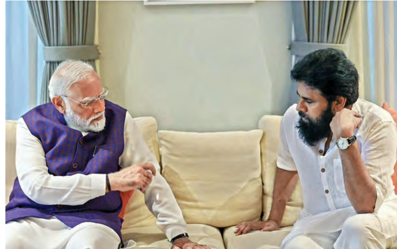
ఆదివారం హైదరాబాద్ లో డిప్యూటీ సీఎం పవన్ నివాసానికి వెళ్లిన పరామర్శించిన ప్రధాని మోడీ