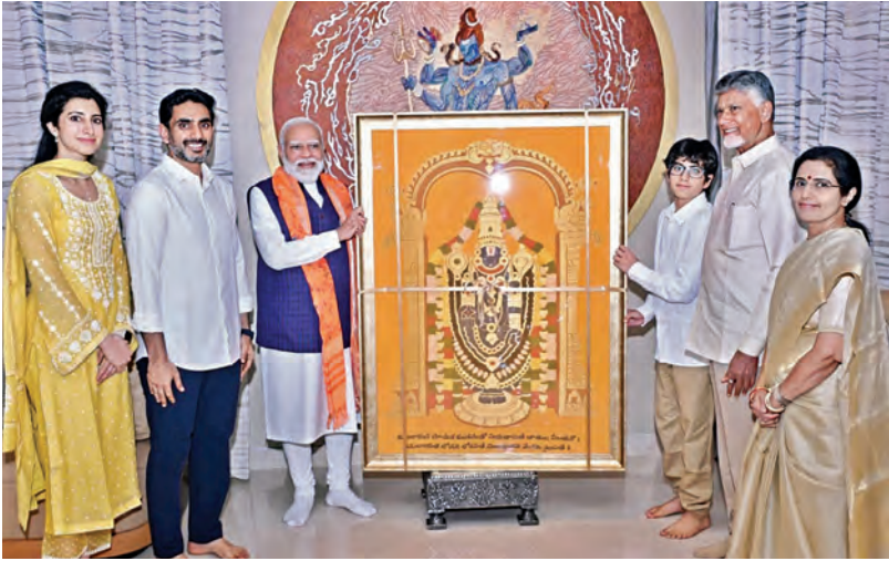
ఆదివారం హైదరాబాద్ లోని చంద్రబాబు నివాసానికి వెళ్లిన మంత్రి లోకేశ్, ఇతర కుటుంబ సభ్యులతో ప్రధాని మోడీ