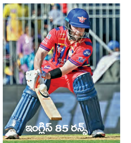
ఇంగ్లీస్ 85 రన్స్

విజయానికి గట్టి పునాది వేశాడు. మధ్యలో సీఎన్ కే కాన్వే తడబాటుకు లోనైంది. సునామయానంగా గెలుపుపొందనుకుంటే, మ్యాచ్ ను వివరించు తీసుకోబడింది. చివరి ఓవర్ తొలి రెండు బంతులకు శివమ దూబే (15 నాటోవ్) సిక్స్ పు బాది సీఎన్ కేను గెలుపొందించాడు. ఈ మ్యాచ్ లో లక్ష్మీ చాలా క్యాచ్ లు జారబడివి మూల్యం చెల్లించుకుంది. లక్ష్మీ బౌలర్లలో